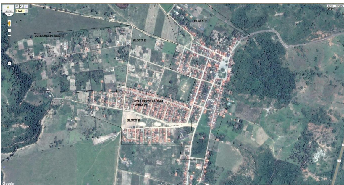
2 – Foto aérea do Distrito de Lustosa