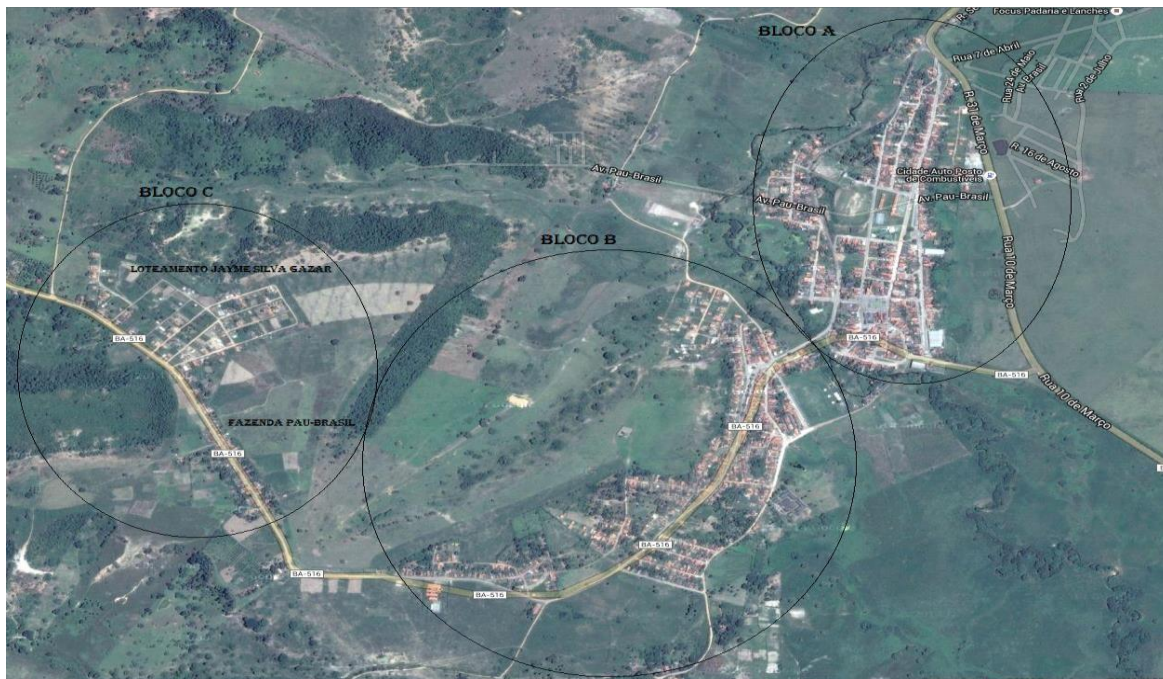
1 – Foto aérea da Sede do Município